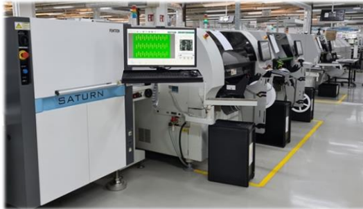
3D-SPI – Lotpasteninspektion

Wir konnten trotz der Pandemie langfristig geplante Investitionen umsetzen und damit in die Zukunft investieren. Beispielsweise haben wir die lasergestützte Lotpasteninspektion durch modernere hochauflösende 3D - SPI Systeme an 5 SMD - Linien ersetzt. Auch einen zweiten Lasermarker zur positionsgenauen und beidseitigen Beschriftung haben wir angeschafft.